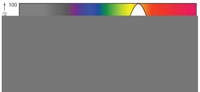
Spectral Power Distribution Colour - MASTER LEDspot D 5.5-50W 3000K PAR20 40D